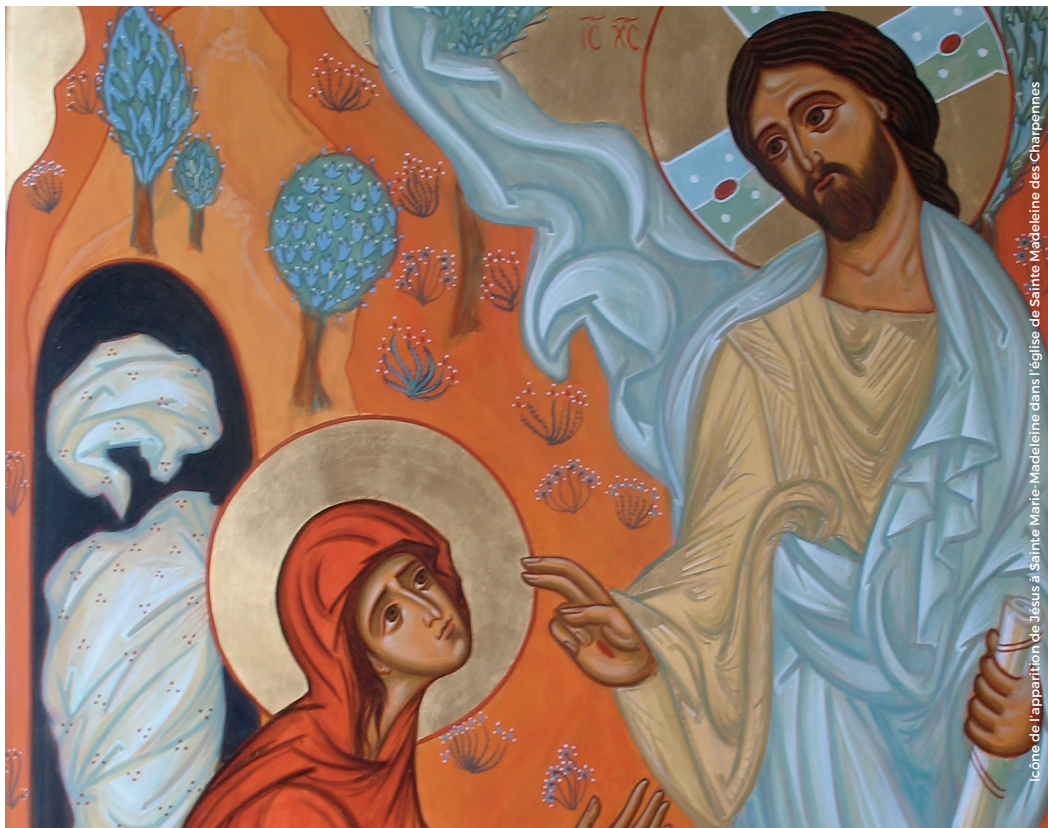
icône de l'apparition de Jésus à Sainte Marie-Madeleine dans l'église de Sainte Madeleine des Charpennes